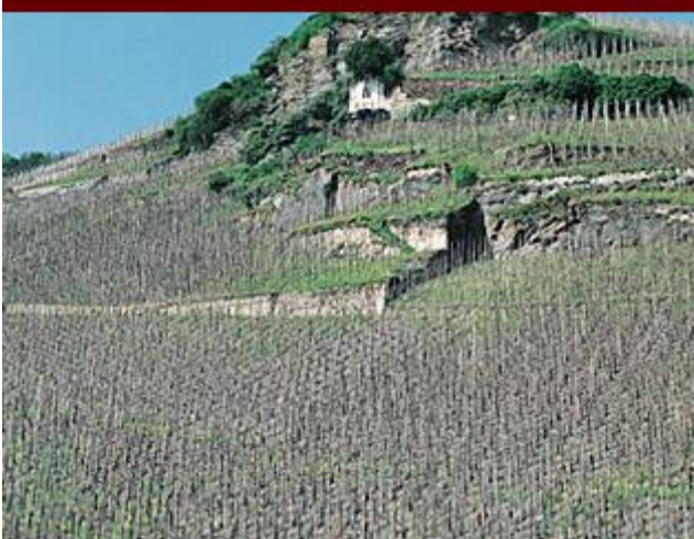
WEHLENER SONNENUHR The Sundial of Wehlen