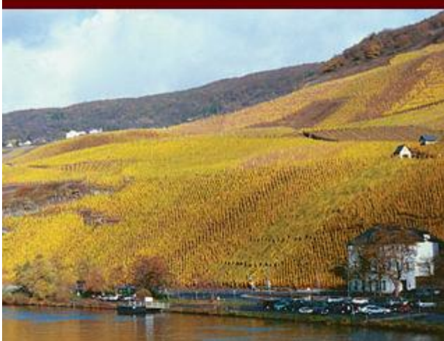
BERNKASTELER LAY The Slate of Bernkastel